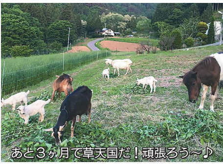
あと3ヶ月で草天国だ！頑張ろう～♪

ない。全然ない。「また雪掻きかあ」と毎朝途方に暮れたあの雪が、今年はずっとくありません。2月になつたらどくんと来るのかもしませんが、北アルプスの山小屋、本場シャモニー、あちらこちらから暖冬のニュースが聞こえてきます。エルニーニョ現象という言葉を初めてまだそれほど経ってはいないのに、自然の勢いは恐ろしいほど早く、日々「これでいいのかな」と思いつつ手探りで進んでいます。 私の住む長野県松本市の山奥は標高800メートルの寒冷地はすなわに、同じ地区でも梅の咲いている所もあるとか。裏山を覗