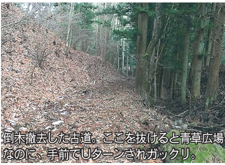
倒木撤去した古道。ここを抜けると青草広場の前に、手前でUターンされガックリ。