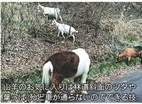
山羊のお気に入り林道斜面のツタや葉っぱ。殆ど車が通らないのでできる技。