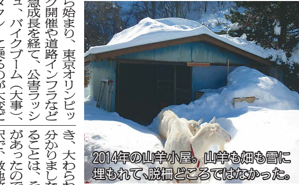
2014年の山羊小屋。山羊も畑も雪に埋もれて、脱柵どころではなかった。

察してみると、確かに咲いてみたもののあれ〜？と嘆いているようなラフノトウを発見！クマは冬眠できたのかな？ これだけ雪がないと、沢水で暮らしている我家は大丈夫なのかな？ 歴史で習った「飢饉」は昔のことのような気がしていましたが、あり得るかも。世界規模でのフォロ ーが可能な時代とはいえず、被害も世界規模なので、物も心もすっかり備えなければ対処できないさぞう。個々地域単位でのシミュレーションは必須ですね。 昭和32年生まれの私は、戦後の混沌や復興は知りませんが、「地域に初めてテレビがやってきた」時代から始まり、東京オリンピック開催や道路インフラなど急成長を経て、公害ラッシュ、バイクブーム(大車)というタクシーに乗るのが大変だったバブル全盛期とその崩壊、中継で知る湾岸戦争と、30歳初めまでの日本の変貌ぶりはかなりのものでした。IT革命が起き、生き方も様々になってきた後 半は、一見平和そうなのに理解不可能な事件が増え、戦争は無くならず、地震・噴火・異常気象と自然の驚異は増すばかり。平和であることの難しさや、同じ時代に、たとえ僅かな時間でもその有り難さを噛み締めた2016年のスタートでした。 それにしても、雪がない。ないと隣の畑に植えてある麦の緑が丸見えなので、我家の山羊たちが電気柵を飛び越えて食べに行