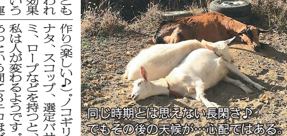
同じ時期とは思えない長閑さ♪でもその後の天候が…心配ではある。

この辺りには、まったく人が通らなくなった旧街道がひっそり&たくさんあります。いつもは犬の散歩で使っていますが、その倒木やボサを取り除いて馬が歩き易いように整備しようという訳です。春のような陽気の中、まるでトレイルランニングコースのコース 作り楽しい♪。ノコギリ、ナタ、スコップ、選定バサミ、ロープなどを持つと、私は人が変わるようです。あつという間に3キロほどが奇麗になりました。そして、さきほど山羊たちを連れていったのですが、一番頑張った小さな沢渡りや青草いっぱい広場に続く急勾配は、怖がって誰も行ってくれませんでした。かなし っ。そして慌てて戻る彼らの後をついて行ったら、そっちの方がいい道でした。「蛇の道は蛇」ですね。しかし彼らの動きには見習つべきものが沢山あります。リーダーに群れで動くこと(安全)、同じ所ではなくどんどん動くこと(安全と根柢やしにしない)、絶妙な好奇心と恐怖心のバランス(新地と安全)、さつさと諦めること(安全)。弱者の草食動物ゆえに身についた数々の智慧