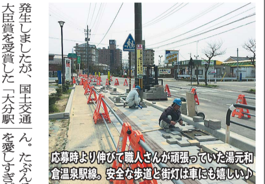
応募時より伸びて職人さんが頑張っていた湯元和倉温泉駅線。安全な歩道と街灯は車にも嬉しい!