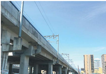
道と空間と高架下が気持ちよくなった大分。駐車も犬の散歩もマイカーもストレスな〜し。

NETWORK NETWORK NETWORK NETWORK NETWORK NETWORK NETWORK NETWORK NETWORK NETWORK NETWORK