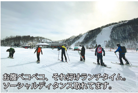
お腹ペコペコ、それ行けランチタイム。ソーシャルディスタンス取れています。

雪される出来なかつた初はバランスボールにパリエソウです。目線と言われても何故か猿人から進化しなかつたダーをつけたものでした。一言でいうと「どんが、スケートボードを経てクターも離せないで、まど少し形になってきました。20年のベテランが乗るが、瞬間差のようにピタッとポーズが決まり、手や体を動かせば、背景にスキー場の景色が見えてくるほど美しく感動します。昔から運動が大好きで、特にフランス感覚は一番の得意分野だった私。バイク以外のスキーに連れてって「世代も、青春を今一度という感じもあり。みな体力も弱もすぐに取戻してしまふのが凄いのですが、以前より体のパーツは弱っているの、早くもアキレス腱損傷や指の剥離骨折と負傷者も発生。でも悲壮感はなく、一定年だしやることやろう」といった感じで、人生を謳歌。ギフス付きで見学に来たりと、まるで青少年の合宿みたい。コロナ禍なので、密にならず黙食でランチ、集合写真はヘルメットにゴーグルにマスクで誰だかさっぱり。でも、ヘタで転んでばかりでも愉快なみんなと一緒に本当に楽しい時間です(ずっと笑えばなし)。さあ、明日からもまた、小さな目標に向かって特訓だーっ!