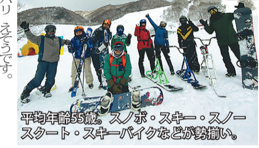
平均年齢55歳。スノボ・スキー・スノースタート・スキーバイクなどが勢揃い。

忘れないうちに、今年の正月に久々に目にした縁起物を報告します。遠い過去の遺物だと思っていた、フロンテグレルに「しめ飾り」を付けたクルマを見ました。さすがに手のひらサイズのお飾り(チョット恥ずかし気)に、可憐な、交通生活スタイルの変化が影響している感じが、もうマスクは外せな