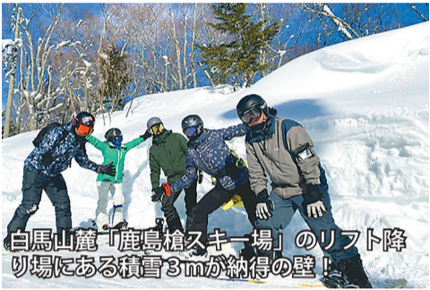
白馬山麓「鹿島槍スキー場」のリフト降り場にある積雪3mが納得の壁!