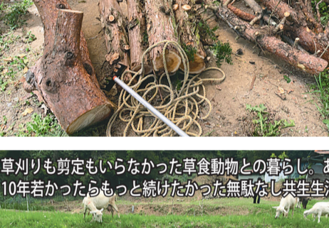
草刈りも剪定もいらなかった草食動物との暮らし。あと10年若かったらもっと続けたかった無駄なし共生生活！