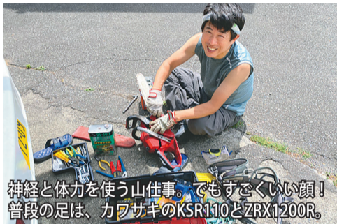
神経と体力を使う山仕事。でもすごくいい顔！普段の足は、カワサキのKSR110とZRX1200R。

涼を求めずにはいられない今年の特異な猛暑。ここらも軽く50株。信州に戻るまでも30℃超えが続き、つもりはないという大家さん。子育て中のツバメも人間も早くからグロッキー気味。「あれ切つてもいいよ。好ライダー仲間が、ビーナスきによって」と仰るもの。ラインを筆頭に各地の高原の、どれも可愛いので簡単道路を目指して繰り返しては判断がつかずません。そこらに動物たちを放牧しては動物たちをなつかしに迎える。なつかしな動物たちは、なぜかと言うと、庭仕事ほどあり、草刈りで夫婦で毎日のように芝刈り機と刈り払い機を稼働させますが、草も樹木の葉も食べてしまうヤギやポニーがいなくなってしまう。好きな作業なのですが、一日から4年も経つと、低木の庭木は大木に成長し、あつという間に2階の屋根を越してしまいました。その数、かくく30本。手が届く株だったツツジやサツキは、2〜5メートルの巨大な塊に大变身。大家さんが手がけた庭には、何