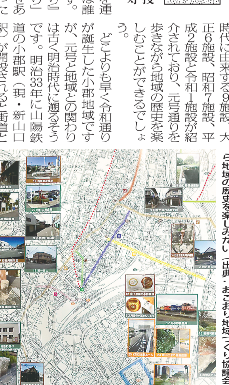
図 おごり「5元号」見て歩きマップ：元号通りを歩きながら地域の歴史を学ばせたい。