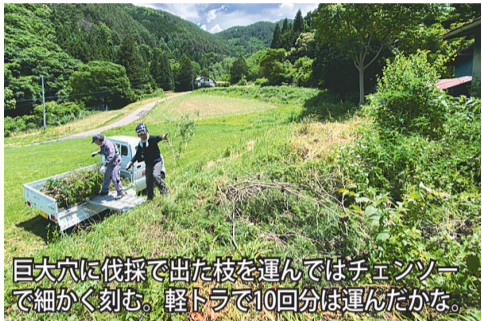
巨大穴に伐採で出た枝を運んではチェーンソーで細かく刻む。軽トラで10回分は運んだかな。