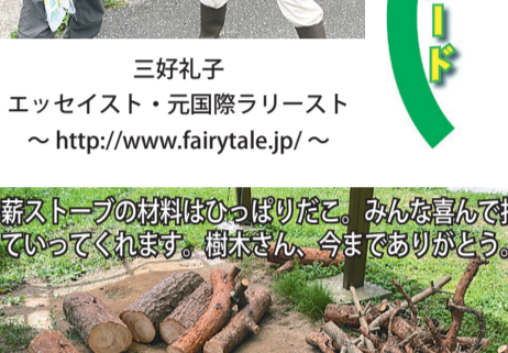
薪ストーブの材料はひっぱりだこ。みんな喜んで持っていくくれます。樹木さん、今までありがとうございます。