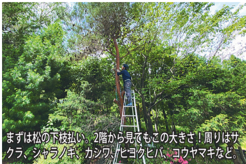
まずは松の下枝払い。2階から見てもこの大きさ！周りはサクラ、シヤマノキ、カシワ、ヒヨクハ、コウヤマキなど。

NETWORK NETWORK NETWORK NETWORK NETWORK NETWORK NETWORK NETWORK NETWORK NETWORK