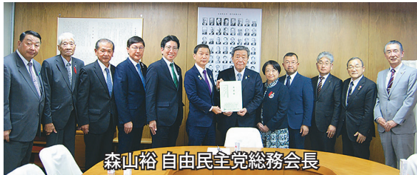
森山裕 自由民主党総務会長