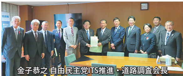
金子恭之 自由民主党ITS推進・道路調査会長