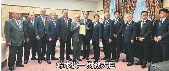
鈴木俊一 財務大臣