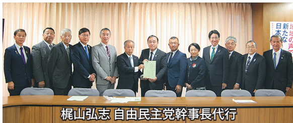
梶山弘志 自由民主党幹事長代行