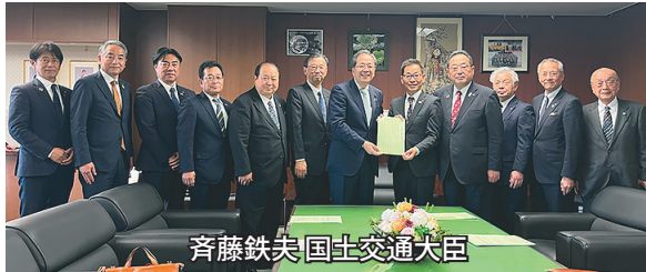
斉藤鉄夫 国土交通大臣