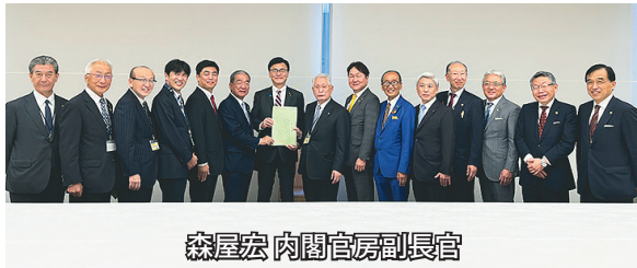
森屋宏 内閣官房副長官