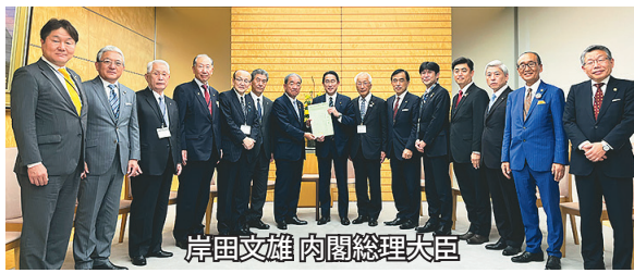
岸田文雄 内閣総理大臣