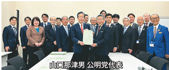
山口那津男 公明党代表